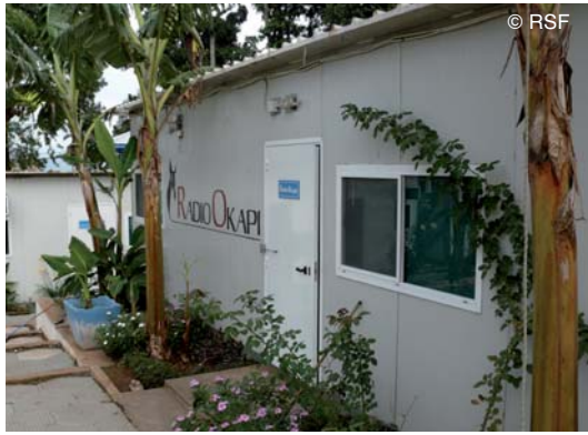
Les locaux de Radio Okapi à Bukavu

Enquête sur les assassinats de journalistes dans la capitale du Sud-Kivu