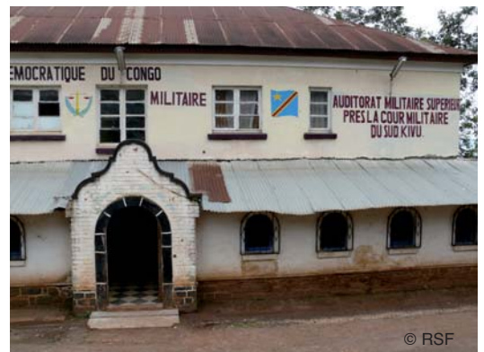
Auditorat militaire supérieur de Bukavu