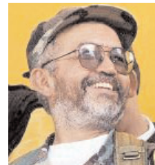
Raúl Reyes, FARC

d'un an. Or, la structure militaire des FARC est restée intacte et un seul de leurs chefs, Simon Trinidad, a été capturé et extradé pour ses liens avec le narcotrafic. L'échec dans la lutte contre les FARC explique en partie la faiblesse du processus de démobilisation. Quand les AUC s'en vont, la guérilla revient. L'autre raison est que le gouvernement a négligé complètement les interférences entre paramilitarisme et narcotrafic. Dès lors, le processus de démobilisation a abouti au fractionnement des anciens AUC en deux camps : les pro-narcos et les autres. Et c'est malheureusement la première tendance qui l'a emporté, avec des gens comme «Don Berna».