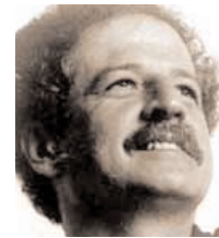
Luis Carlos Galán