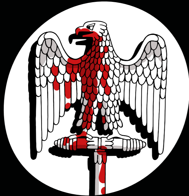
МЕТОД №1 Предоставить свою медиа-империю на службу режима.