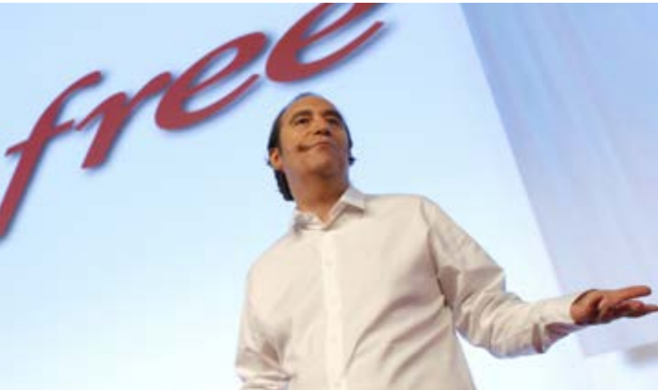
Кзавье Ньель на пресс-конференции, январь 2012 г.

“Расследования, репортажи, да и вообще информация - это нечто разделяющее людей, а развлечения - нет”