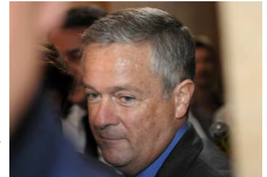
Жан-Мари Месье, выходящий из зала суда, июнь 2010 г.