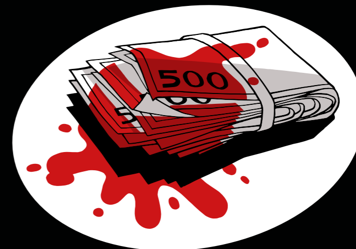
МЕТОД №5 Купить СМИ, чтобы подкупить власть.