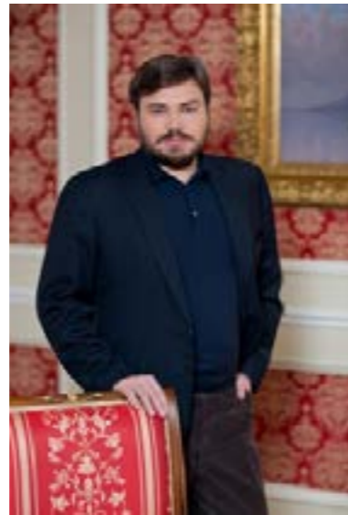
Константин Малофеев использует свое состояние для поддержки ультра-консервативной идеологии D.R.