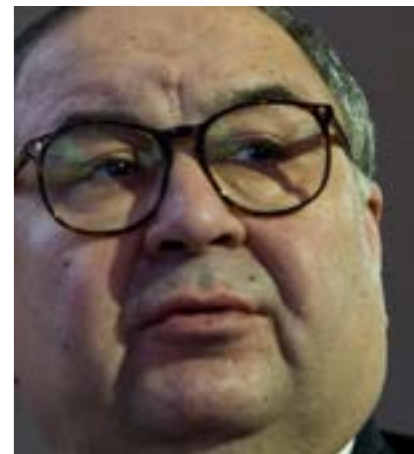
Алишер Усманов на экономическом форуме в Давосе в январе 2013 года

Именно тогда появились первые качественные расследования, военные репортажи и откровения про тоталитарное прошлое. Несмотря на жестокую конкуренцию между олигархами-владельцами СМИ, их личные амбиции и достаточно мутные отношения с властью, многие говорят о “золотом веке” российской журналистики. Самый яркий пример - это безусловно блестящее освещение прессой первой чеченской войны (1994-1996), которое заставило общественное