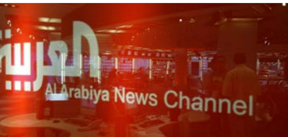
Ньюзрум телеканала Al Arabiya в Дубаи в 2003 г.

Стиль работы Al Arabiya открыто копирует крупные западные телеканалы, а основная модель для него это CNN. Его журналисты занимаются углублёнными расследованиями, делают интервью ведущих мировых политиков (в частности, Барака Обамы 26 января 2009 года), но у них нет такой возможности, когда речь заходит о саудовском руководстве. Саудовская Аравия не является объектом расследований для журналистов телеканала