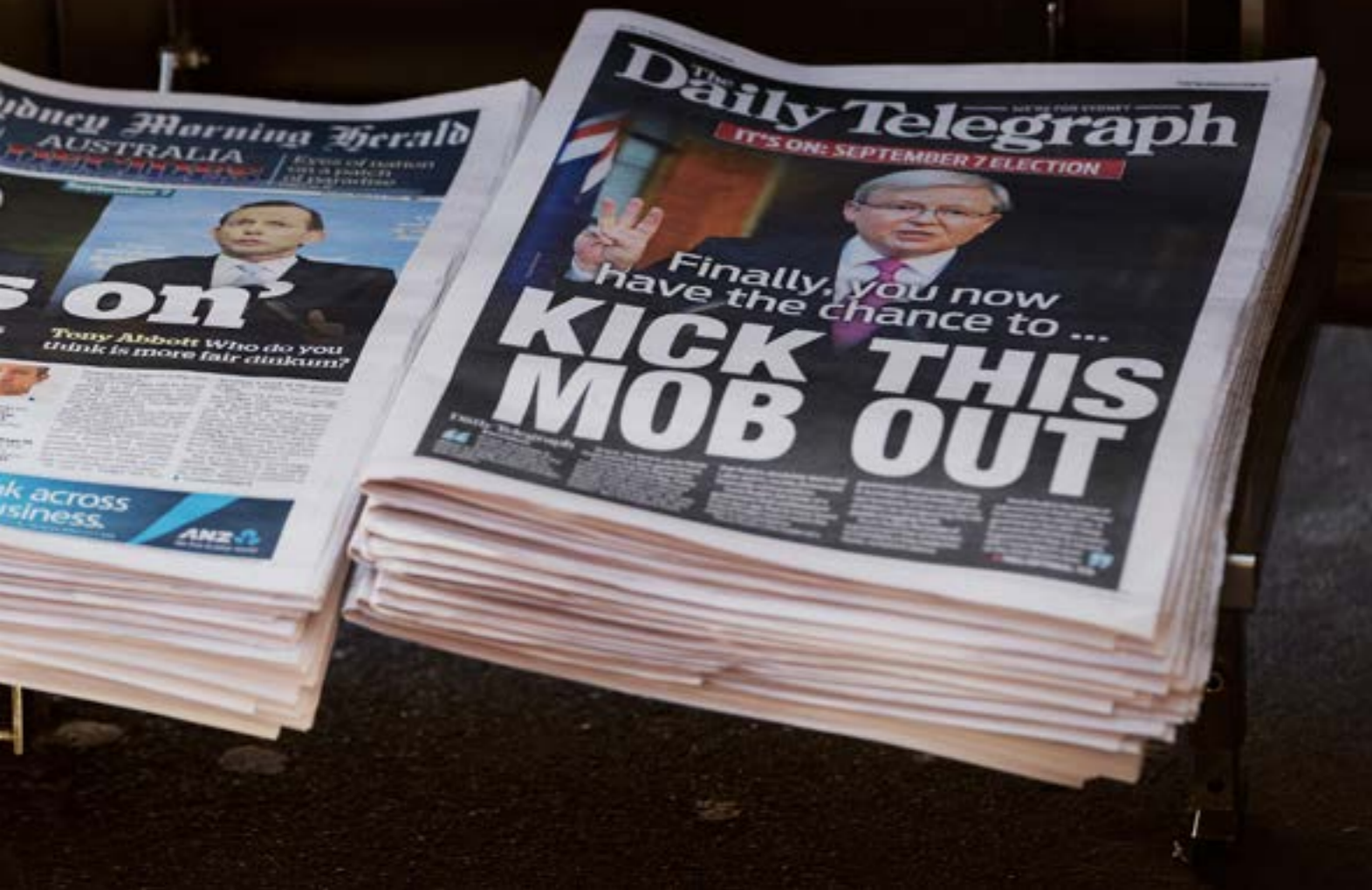
Первая полоса принадлежащей Руперту Мёрдоку The Daily Telegraph с призывом к избирателям избавиться от австралийского премьер-министра во время предвыборной кампании в августе 2015 г.

десятков наименований СМИ, некоторые из которых безусловно можно отнести к ведущим.