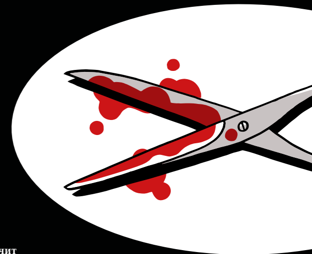
МЕТОД №4 Подвергать цензуре всё, что противоречит собственным интересам.