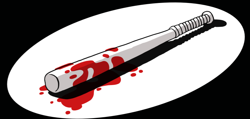
МЕТОД №3 Использовать СМИ, чтобы нанести удар по противникам.