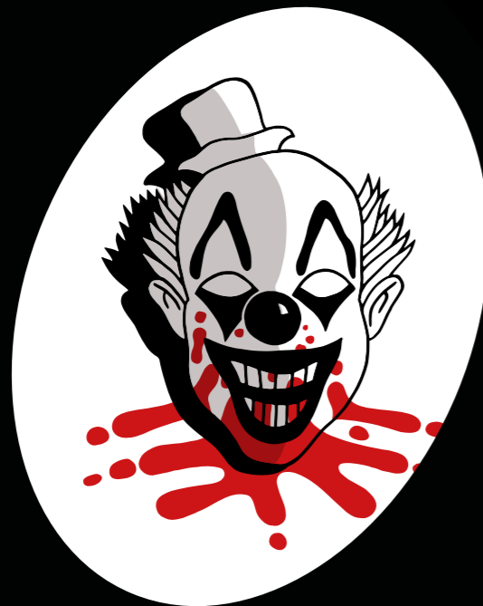
МЕТОД №2 Заменить информацию шоу и развлечениями.