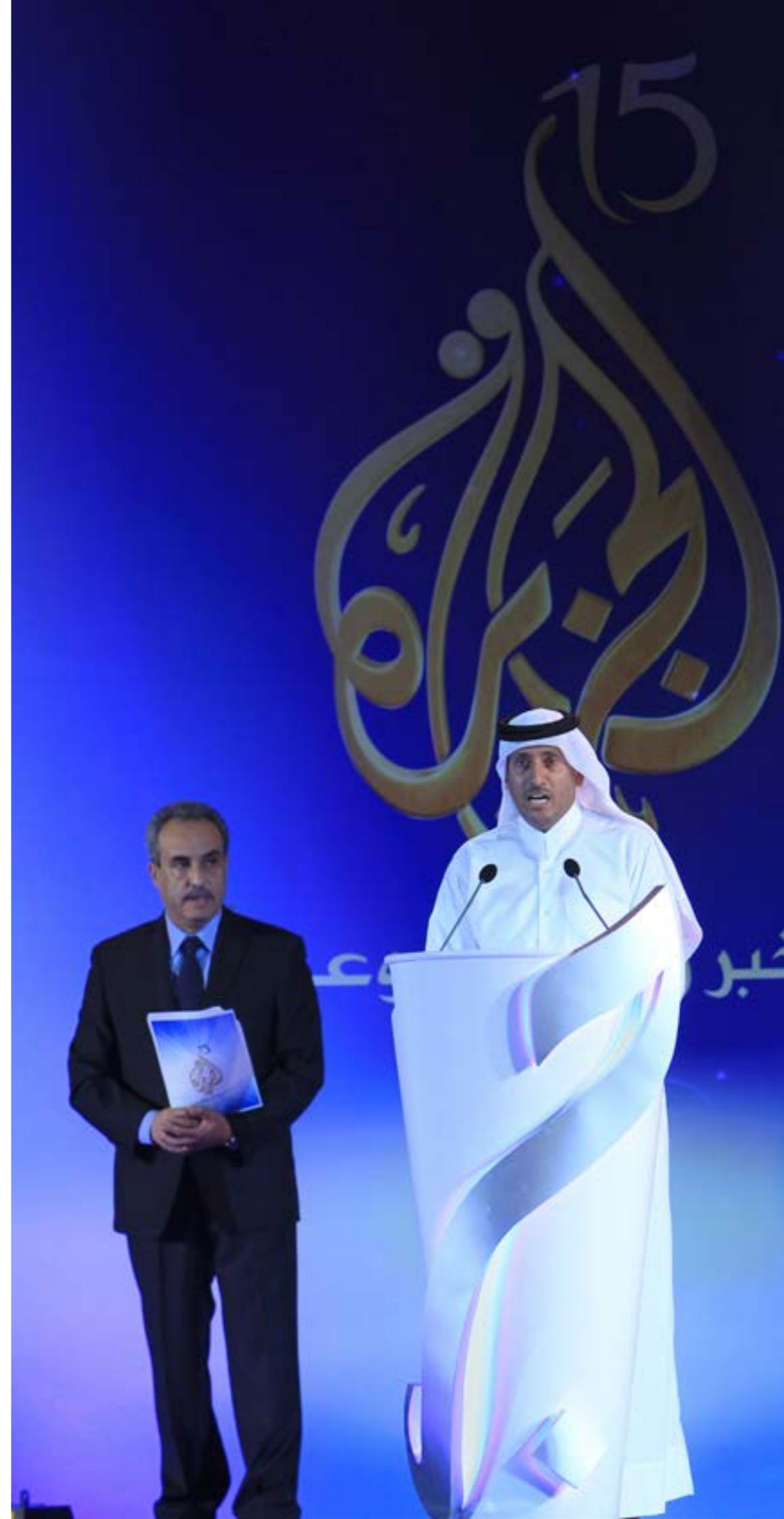
Шейх Катара Хаммад бен Яссем Аль Тани на церемонии 15 годовщины телеканала AL JAZEERA в Дохе в ноябре 2011 г.

История СМИ - это также история эгоизма и престижа. Феномен может затрагивать монархию, политическую династию, религиозную коммуну или целую страну. Можно ли считать, что телеканал Al Jazeera, который произвел революцию в арабском мире - это голос Катара или княжеской династии Аль-Тани (Al-Thani), которая вот уже 150 лет царствует над судьбой этой небольшой страны Залива? А её конкурент Al Arabiya? Чисто редакционная логика тут уходит на второй план по отношению к другим более или менее явным мотивам - политическому или экономическому престижу, персональным амбициям и сведению счётов. Таков пример многих африканских, ближневосточных и индийских СМИ которые создаются ad hoc для защиты интересов той или иной монархии, семейства или клана. Это также определённая форма контроля над частной прессой при поддержке олигархов, имеющих семейных или иные связи с властью, и которые в большинстве стран Залива из поколения в поколение и являются олицетворением власти. Это та ситуация, когда информация попадает в