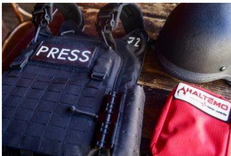
Оборудование, временно одолженное RSF журналистам.

Работая в тесном сотрудничестве с партнерской организацией, Институтом массовой информации (IMI) и другой местной организацией – Національній спілкою журналістів України (НСЖУ), которая также распространяла оборудование, предоставленное RSF организация смогла предоставить украинским и международным репортерам: