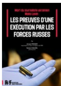
Фото для обкладинки

Куля, знайдена в землі у місці, де раніше лежало тіло Макса Левіна. Кулю й гільзу знайшли 30 травня 2022 року під час обшуку, ініційованого "Репортерами", у лісі біля Гути-Межигірської на північ від Києва, Україна.