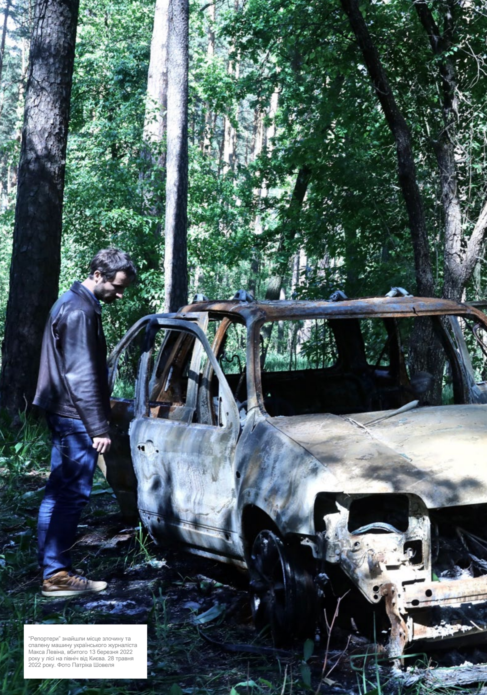
“Репортери” знайшли місце злочину та спалену машину українського журналіста Максима Левіна, вбитого 13 березня 2022 року у лісі на північ від Києва. 28 травня 2022 року.

“Репортери без кордонів” (РБК) зібрали докази, на які спирається цей звіт, у процесі розслідування, проведеного ними в Україні з 24 травня по 3 червня 2022 року. “Репортери” передали знайдені докази українським правоохоронцям, а також нададуть їм копію цього звіту. Докази, зібрані “Репортерами”, вказують на те, що українського фотожурналіста Максима Левіна і його друга, який був із ним на момент смерті, холоднокривно стратили російські військові в день, коли ті зникли, – 13 березня 2022 року – ймовірно, після допитів і катувань. Тіло й машину Левіна знайшли 1 квітня в лісі, який тоді був частиною фронту на північ від Києва.