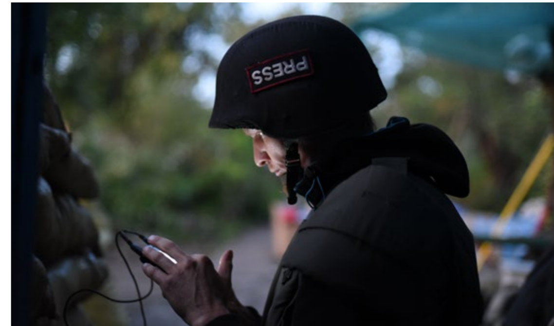
Український фотожурналіст Макс Левін, убитий під Києвом

“Репортери без кордонів” (РБК) зібрали докази, на які спирається цей звіт, у процесі розслідування, проведеного ними в Україні з 24 травня по 3 червня 2022 року. “Репортери” передали знайдені докази українським правоохоронцям, а також нададуть їм копію цього звіту. Докази, зібрані “Репортерами”, вказують на те, що українського фотожурналіста Максима Левіна і його друга, який був із ним на момент смерті, холоднокривно стратили російські військові в день, коли ті зникли, – 13 березня 2022 року – ймовірно, після допитів і катувань. Тіло й машину Левіна знайшли 1 квітня в лісі, який тоді був частиною фронту на північ від Києва.