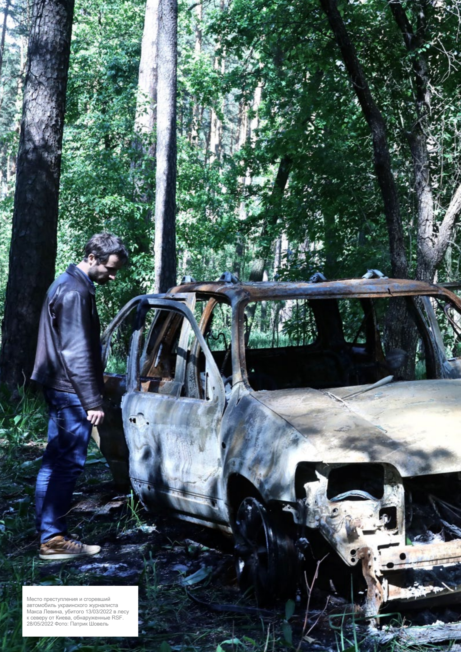
Место преступления и сгоревший автомобиль украинского журналиста Макса Левина, убитого 13/03/2022 в лесу к северу от Киева, обнаруженные RSF. 28/05/2022