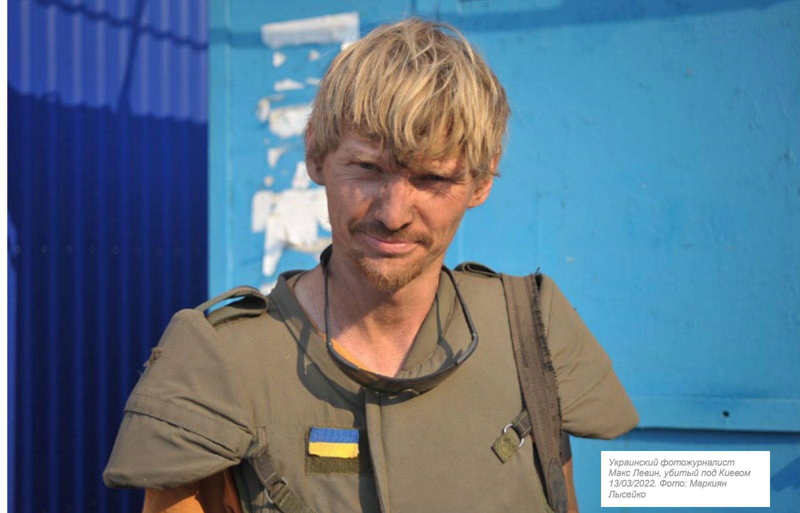
Украинский фотожурналист Макс Левин, убитый под Киевом 13/03/2022.