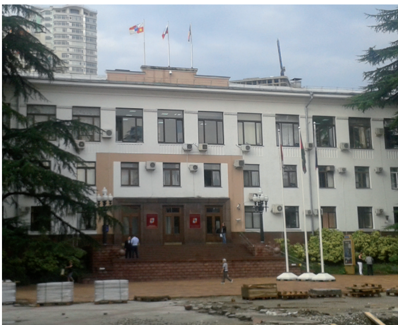
Bâtiment de l'administration municipale de Sochi