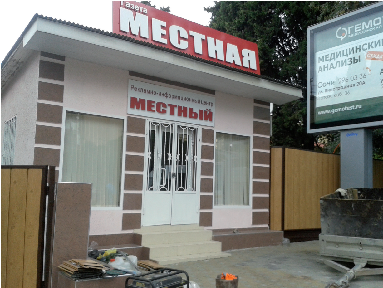
Les locaux du journal Mestnaïa .